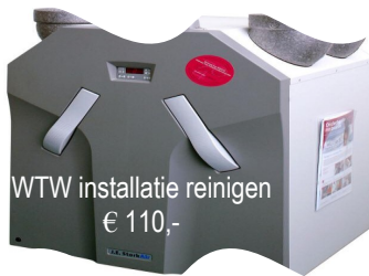
WTW installatie reinigen € 110,-

OF een éénmalige groot onderhoud zonder servicecontract.