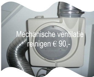
Mechanische ventilatie reinigen € 90,-