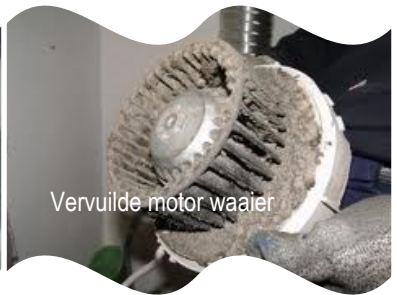
Vervuilde motor waaier

De ventilatie-unit en motor(en) worden op locatie gereinigd door middel van een speciale vloeistof. Indien nodig worden de lagers vervangen om eventuele toekomstige storingen en/of geluidsoverlast te voorkomen. Als de ventilatie-unit sterk verouderd is, stellen wij voor deze te vervangen om onnodig veel stroomverbruik te voorkomen en een 100 procent gezond binnenklimaat te kunnen garanderen.